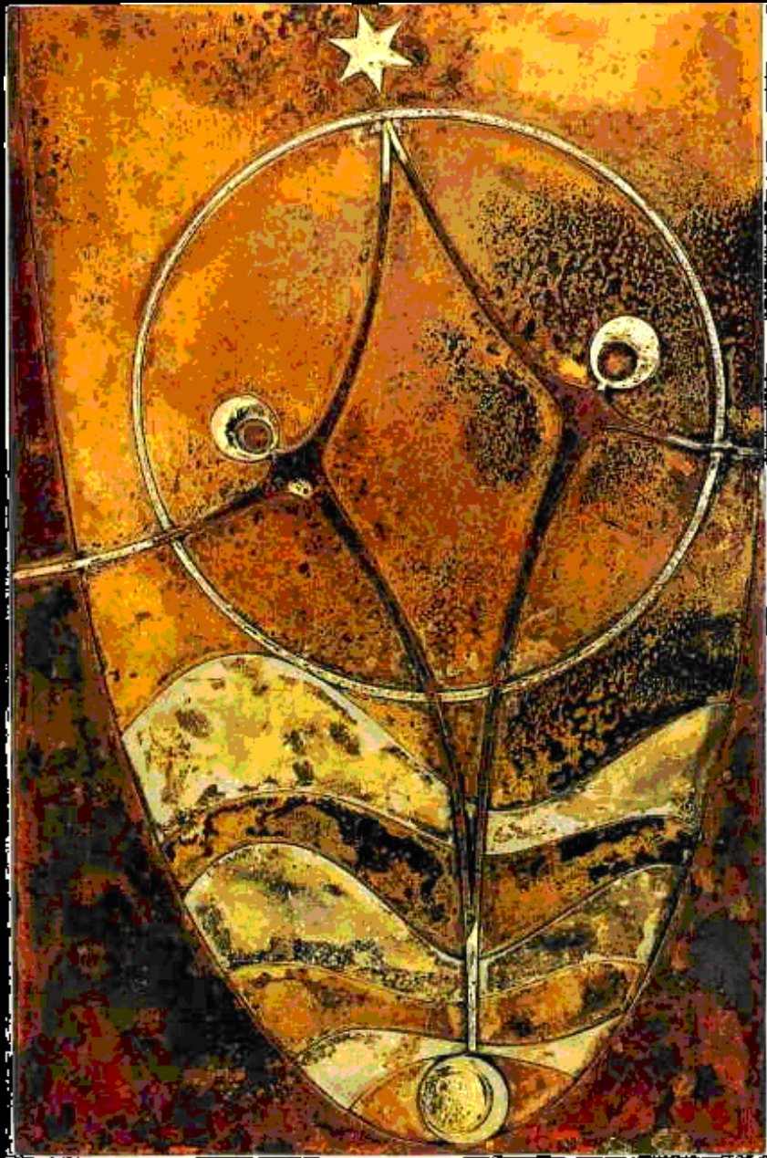
Josua Boesch, Die Auferstehung des Judas