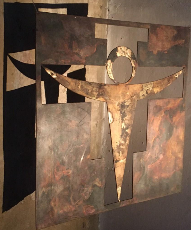
Kreuz und Auferstehung JB