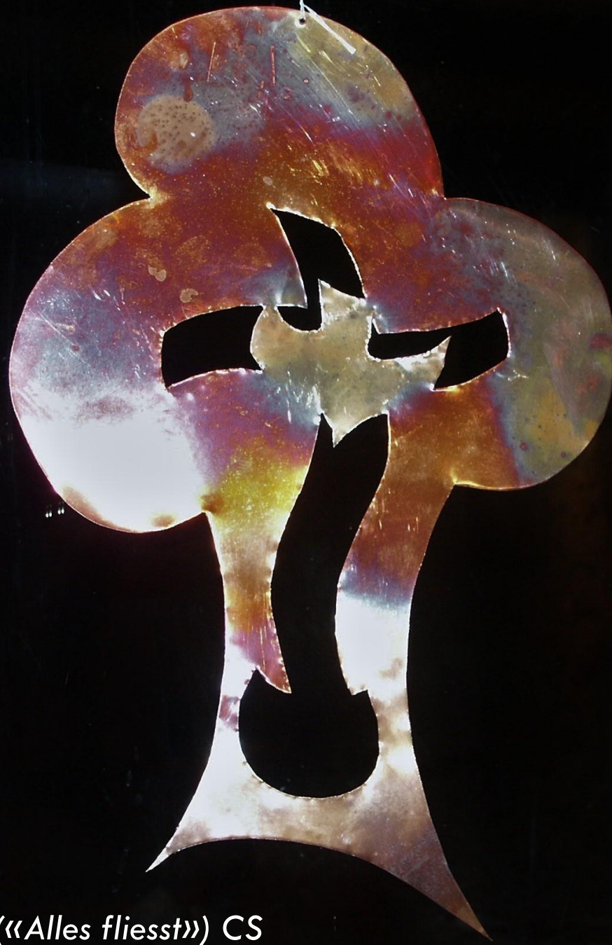
Trinität («Alles fließt») CS