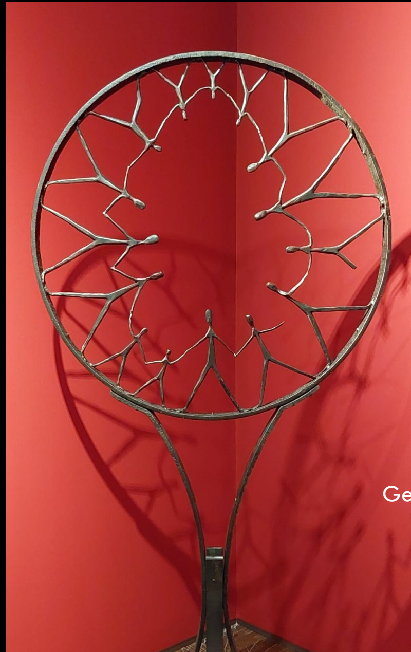
Christoph Stückelberger Gemeinschaft und Versöhnung Biennale Venedig 2022